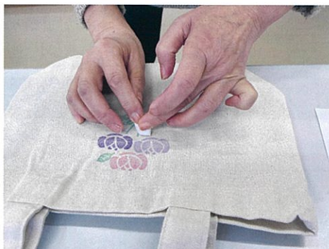
(けしごむはんこを作ろう)