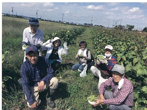
(『丹波黒枝豆』の収穫体験)